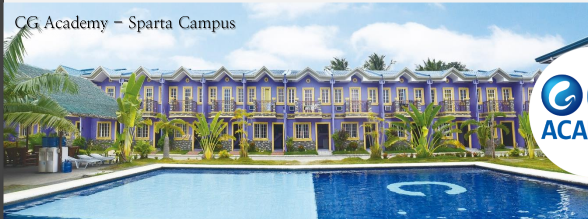
CG Academy – Sparta Campus